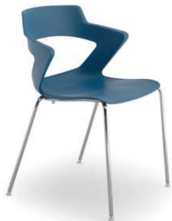
ZN001CR Sedia 4 gambe, cromata Four legged chromed chair.