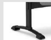
Gamba panca con forma a "T" T-shaped legs