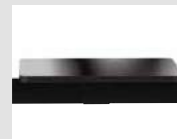
Tavolino Small table