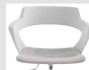
Pannellino imbottito Upholstery seat panel