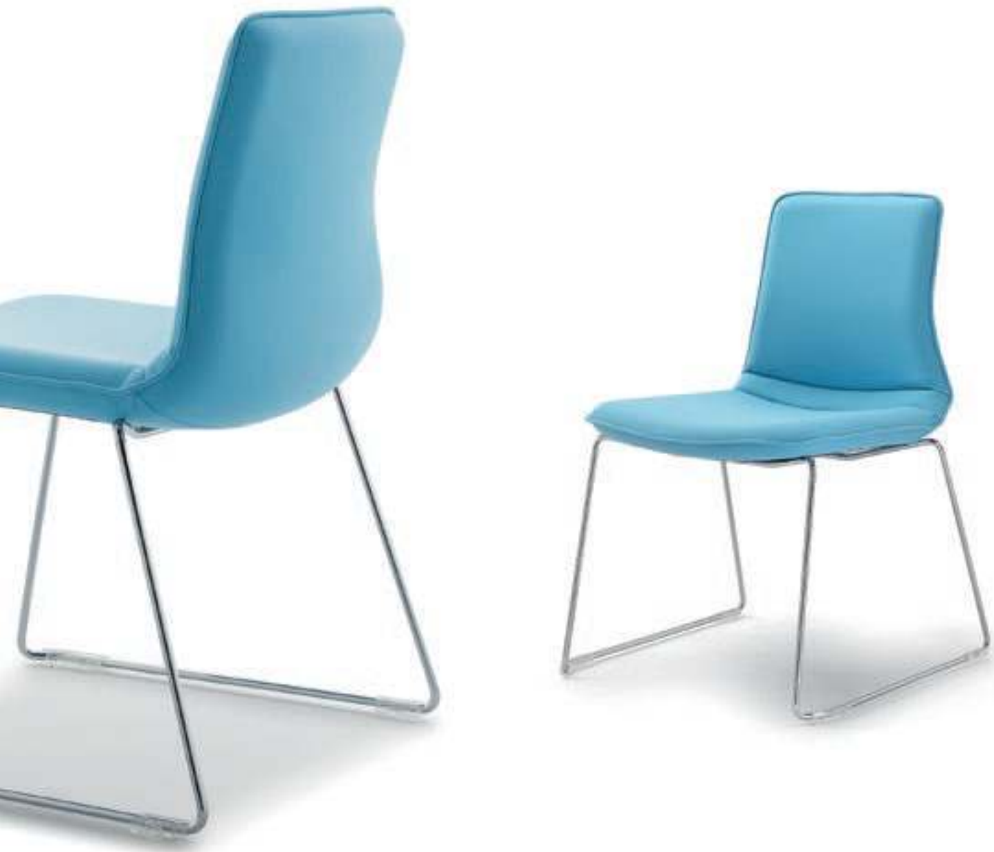
IC201 Struttura cromata, senza braccioli Chromed frame, without armrests