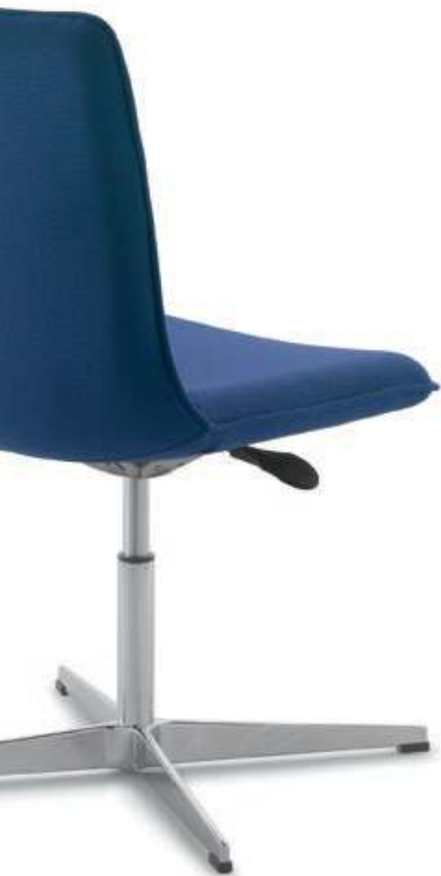
IC211 Poltrona girevole, senza braccioli, base a 4 razze in alluminio lucido Swivel chair, no armrests, 4-sprong base in polished aluminium