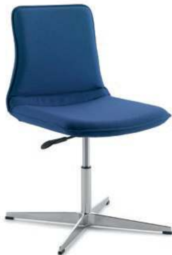
Un tocco di eleganza propone la versione fissa su base a 4 razze in alluminio pressofuso. Disponibile con e senza braccioli è ideale come seduta per una postazione di home office o come seduta per sala riunione.

The fix chair with a four-sprong base in die-cast aluminium is particularly elegant and it is available with or without armrests. It is ideal for the home office as well as for meeting areas.