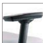
3D Bracciolo regolabile -allungabile e orientabile 3D Adjustable extensible and rotating arm