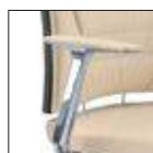
Bracciolo alluminio, con soprabracciolo imbottito o poliuretano nero Aluminium arm, padded or black polyurethane top