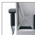
4D Bracciolo regolabile, orientabile, allungabile, allargabile 4D Adjustable, rotating, extensible, stretchable arm