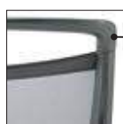
* Struttura schienale nera Black backrest structure KRU1.. KRU2..