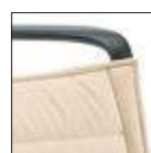
KORUM (PLUS) Schienale imbottito Padded backrest