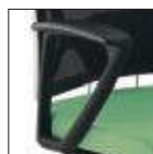
Bracciolo poliuretano Polyurethane arm