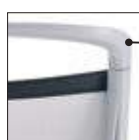
** Struttura schienale grigia Grey backrest structure KRU3.. KRU4..