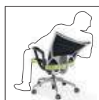
Schienale flessibile Flexing backrest