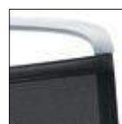
KORUM (MESH) Schienale rete Mesh backrest