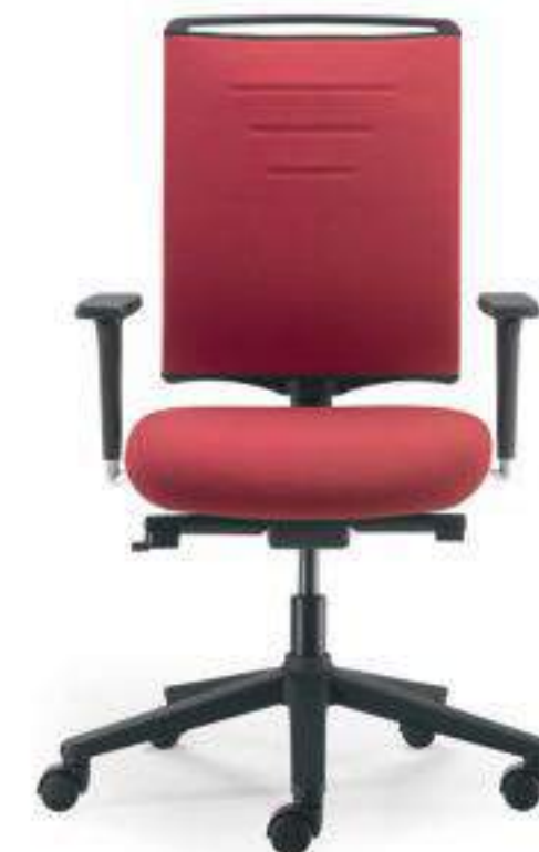
EVO432SD+BR006 Schienale alto, syncro, braccioli regolabili 2D in alluminio lucidato High back, synchro mechanism, die-cast polished aluminium 2D adjustable armrests

I braccioli regolabili in altezza 2D, nella versione lucidata, hanno la struttura portante in alluminio pressofuso con copertine e top superiore in nylon nero. A richiesta è disponibile un anche un top in PU morbido.