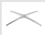
19 Base 4 razze in alluminio lucidato. 4-spoke base made of polished aluminum.