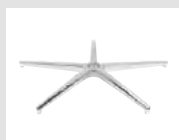
18 Base piramidale in alluminio lucidato. Pyramidal base made of polished aluminum.