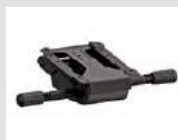
S9 Meccanismo synchron con 4 posizioni di blocco. Synchron mechanism with 4 blocking positions.