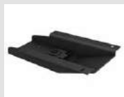
M1 Piastra fissa girevole in acciaio verniciato nero. Fixed and revolving plate made of black-painted steel.