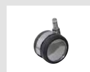
W6 Ruota cromata gommata autofrenante con battistrada morbido Ø65. Self-braking chrome rubber castor with soft tread Ø65