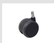
W4 Ruota gommata autofrenante con battistrada morbido Ø65. Self-braking rubber castor with soft tread Ø65.