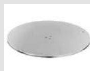
22 Base a disco in acciaio inox cromato. Disk base made of stainless chrome steel.