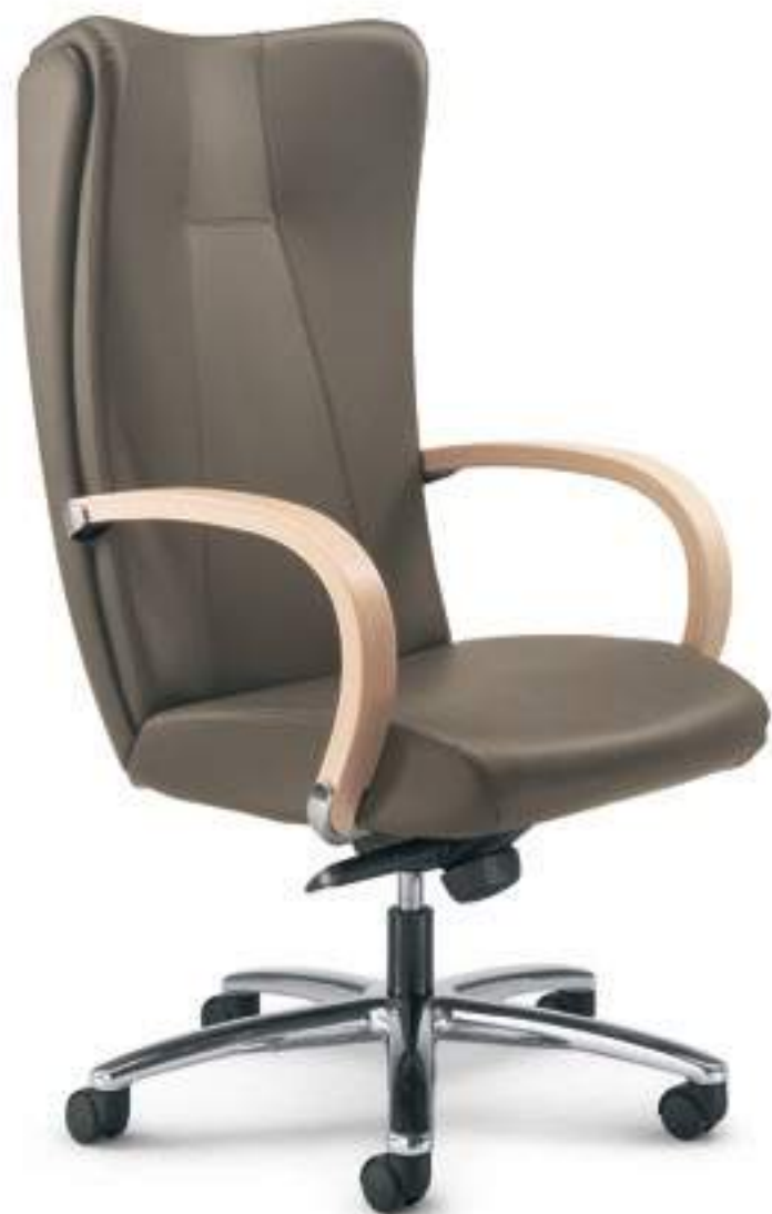
KI161A Schienale alto, meccanismo oscillante a fulcro avanzato, braccioli verniciati High back, forward tilting mechanism, stained armrests