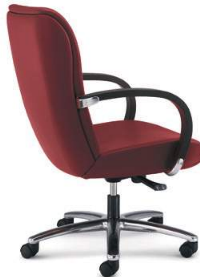
KI162B Schienale basso, meccanismo oscillante a fulcro centrale, braccioli verniciati Low back, central tilting mechanism, stained armrests