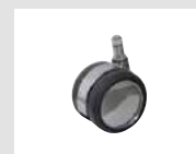
W6 Ruota cromata gommata autofrenante con battistrada morbido Ø65. Self-braking chrome rubber castor with soft tread Ø65