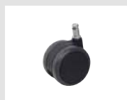
W4 Ruota gommata autofrenante con battistrada morbido Ø65. Self-braking rubber castor with soft tread Ø65.