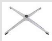
20 Base 4 razze in alluminio lucidato con piedini di appoggio applicati. 4-spoke base made of polished aluminum with little support feet.