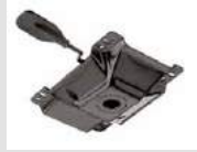
M2 Piastra leva gas in acciaio verniciato nero. Gas lift made of black-painted steel.