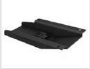
M4 Piastra fissa girevole in acciaio verniciato nero. Fixed and revolving plate made of black-painted steel.