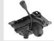
O2 Meccanismo oscillante libero. Free oscillating mechanism.