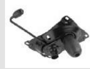
O3 Meccanismo oscillante libero. Free oscillating mechanism.