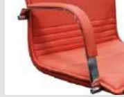
FZ Bracciolo fisso in acciaio cromato con imbottito. Fixed armrest made of chrome steel with padded top.