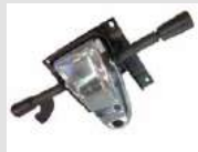
O7 Meccanismo oscillante con fulcro avanzato e 5 posizioni di blocco e regolazione laterale di tensione. Oscillating mechanism with advanced pivot and 5 blocking positions and lateral tension adjustment.