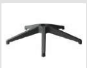
10 Base piramidale in nylon. Pyramidal nylon base