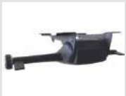
O5 Meccanismo oscillante con fulcro avanzato e 5 posizioni di blocco e regolazione laterale di tensione. Oscillating mechanism with advanced pivot and 5 blocking positions and lateral tension adjustment.