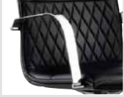
FP Bracciolo fisso in acciaio cromato. Fixed armrest made of chrome steel.