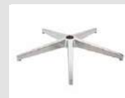
16 Base piramidale in alluminio lucidato. Pyramidal base made of polished aluminum.