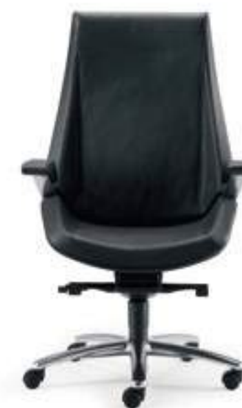
CQ001A Schienale alto, meccanismo oscillante a fulcro avanzato, braccioli High back, forward tilting mechanism, armrests