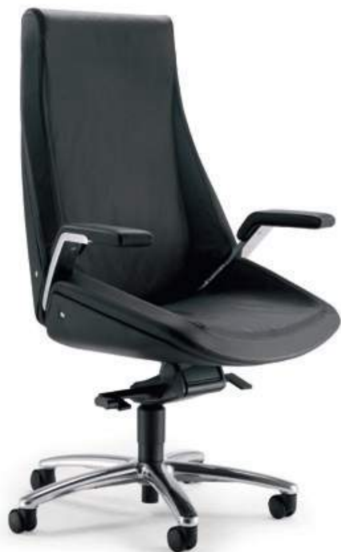
CQ001A Schienale alto, meccanismo oscillante a fulcro avanzato, braccioli High back, forward tilting mechanism, armrests

Cuciture sartoriali, braccioli in alluminio, imbottiture in poliuretano espanso flessibile schiumato ignifugo, meccanismo a fulcro avanzato con regolazione della tensione tramite leva laterale, basi in alluminio. Il top per il massimo.