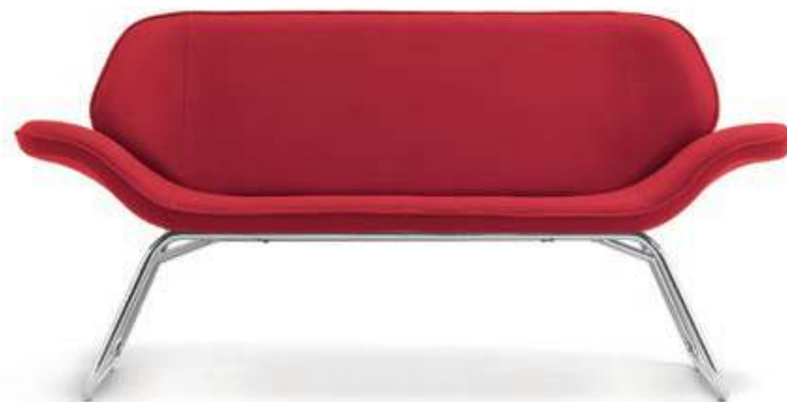
VL002C Divano, struttura cromata Two-seater, chromed base

Il divano a due posti presenta un design pulito e ben distribuito; la struttura di supporto molto leggera che accentua l'eleganza formale è disponibile nella finitura cromata o verniciata bianca.