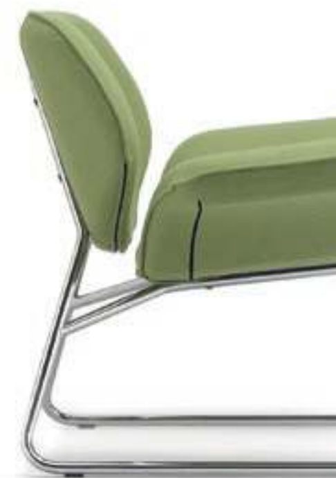
VL001C Poltrona, struttura cromato Armchair, chromed base