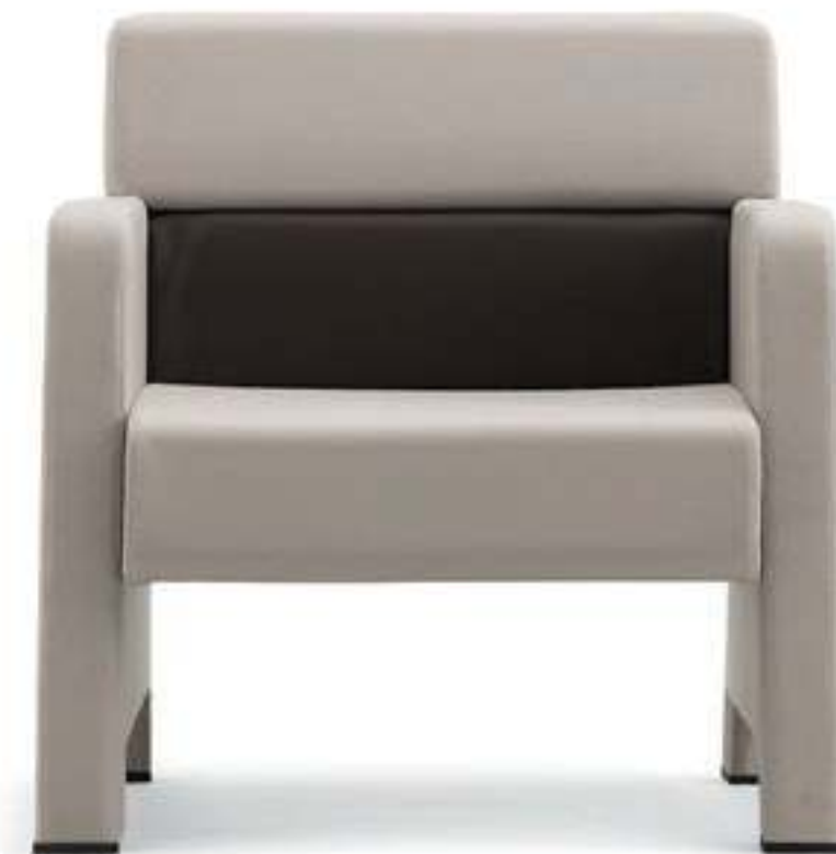
MW001 Poltrona con fianchi a terra Armchair with full upholstered armrests

Le geometrie della poltrona esaltano l'eleganza della forma ed il design essenziale che è evidenziato dalla linea trapezoidale del bracciolo. Le dimensioni generose, ma proporzionate, conferiscono alla seduta un'elegante aspetto estetico.