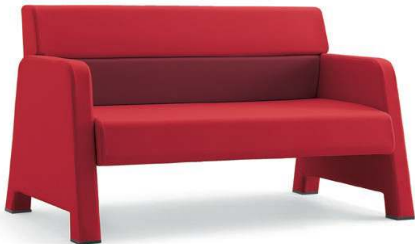
MW002 Divano con fianchi a terra Two-seater with full upholstered armrests