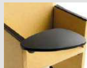
Tavoletta scrittoio antipanico in polipropilene Polypropylene anti-panic writing tablet