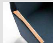
Copri bracciolo in legno Wooden arm pad