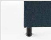
Piedini fissi Fixed slides