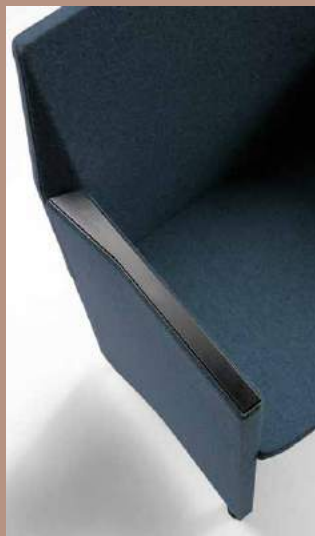
Copri bracciolo in poliuretano Polypropylene armrest cover