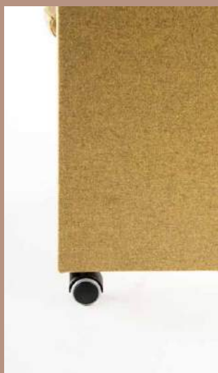
Ruote piroettanti Swivel castors