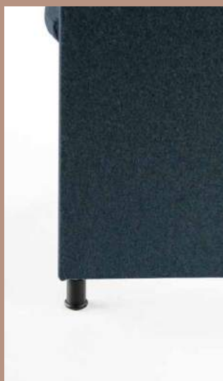
Piedini fissi Fixed slides