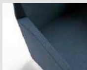
Senza copri bracciolo Without arm pad