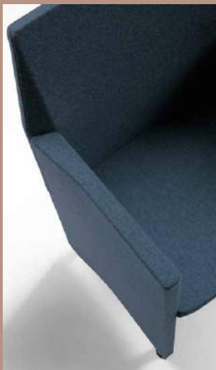
Senza copri bracciolo Without armrest cover