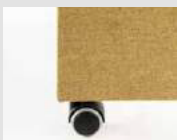
Ruote piroettanti Swivel castors