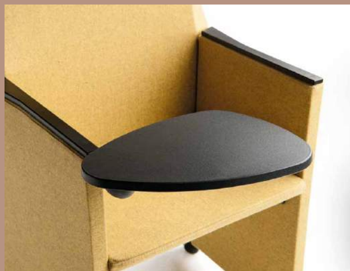
Tavoletta scrittoio antipanico in polipropilene Antipanic tablet arm in polypropylene