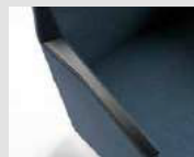
Copri bracciolo in poliuretano Polypropylene arm pad