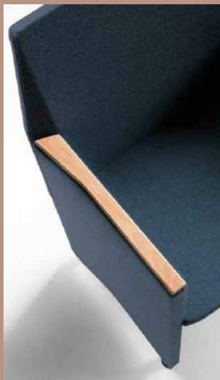
Copri bracciolo in legno Wooden armrest cover