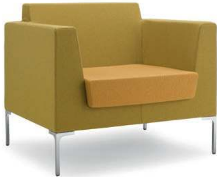
FR001 Poltrona imbottita Armchair, fully upholstered