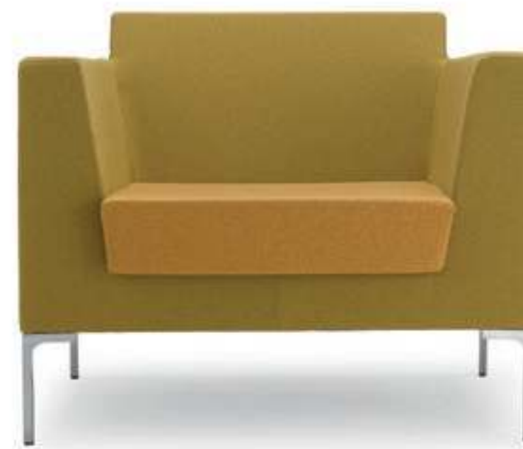
FR001 Poltrona imbottita Armchair, fully upholstered

Range of sofas and armchairs with compact design. FRED has soft and easily fitting seatings to satisfy almost any need in modern office and contract spaces.