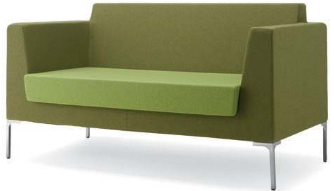
FR002 Divano imbottito Two-seater, fully upholstered