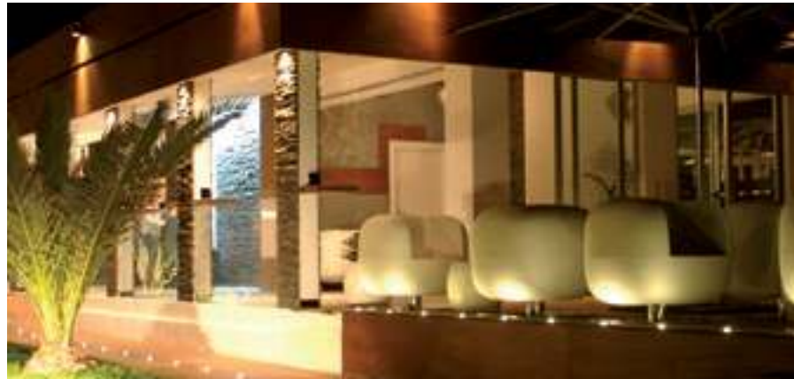
Styles: Stefano Getzel