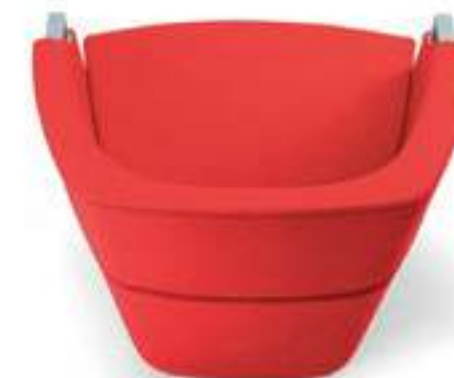
AT070 Poltrona imbottita Armchair, full upholstered