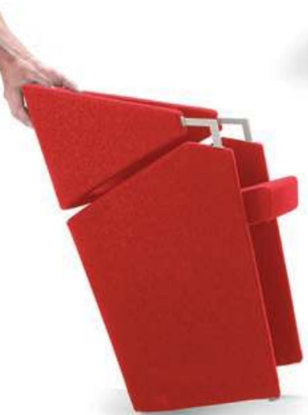
AT070X Poltrona imbottita, tavoletta scrittoio Armchair, full upholstered, writing tablet